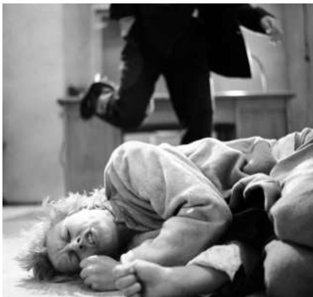
Kadr z filmu Przesłuchanie, reż. Ryszard Bugajski, 1982

Literatura drugiego obiegu była rozpowszechniana półlegalnie. Stan wojenny (1981) podzielił środowisko artystyczne na popierających i bojkotujących działania władz. Ci drudzy powrócili do publikowania w drugim obiegu i występowania w pomieszczeniach udostępnianych przez Kościół. Taka sytuacja utrzymywała się do 1989 r.