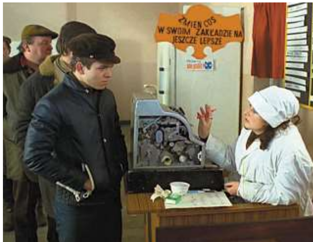
Kadr z filmu Miś , reż. Stanisław Bareja, 1980