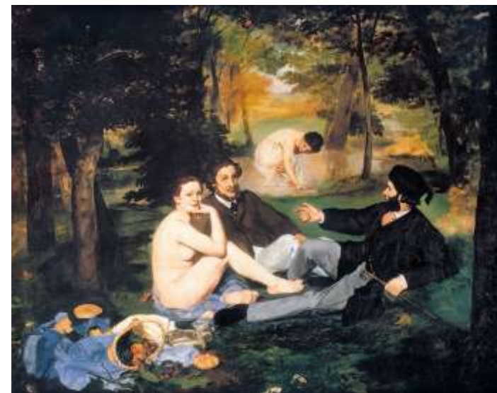
Śniadanie na trawie (fr. Le déjeuner sur l'herbe) – obraz olejny francuskiego malarza Édouarda Maneta.