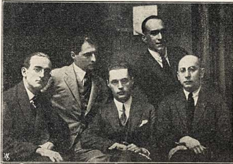
JAN LECHOŃ, JULJAN TUWIM, KAZIMIERZ WIERZYŃSKI, JAROSŁAW IWASZKIEWICZ, ANTONI SŁONIMSKI

Grupa poetów, która uformowała się ok. 1919 r. wokół miesięcznika poetyckiego „Pro Arte et Studio” i kawiarni „Pod Picadorem”. Jej trzon stanowili: Jan Lechoń, Julian Tuwim, Jarosław Iwaszkiewicz, Antoni Słonimski i Kazimierz Wierzyński.