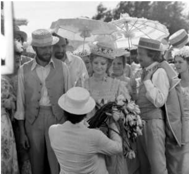
• Kadry z filmu Noce i dnie w reżyserii Jerzego Antczaka, 1975