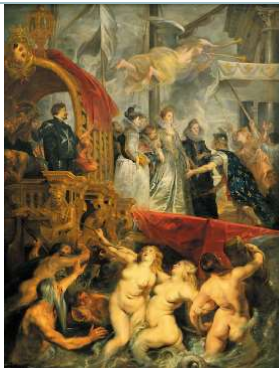
Peter Paul Rubens, Przybycie Marii Medycejskiej do Marsylii, ok. 1622–1625

Realne zdarzenie rozgrywa się na drugim planie, podczas gdy pierwszy wypełniają postacie mitologiczne, ochraniające królewski statek w drodze do Marsylii: Neptun, trytony (pół ludzie, pół ryby) i nereidy (nimfy morskie). Nad schodzącą z pokładu Marią unosi się Fama (bogini wieści), która dmie jednocześnie w dwie trąby.