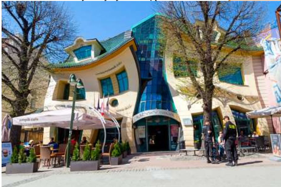
„Krzywy dom” w Sopocie, 2004