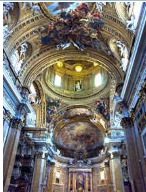
Wnętrze kościoła Il Gesù (Jezus) w Rzymie, 1568–1584

Macierzysta świątynia zakonu jezuitów w Rzymie stała się prototypem wielu kościołów katolickich budowanych po soborze trydenckim.