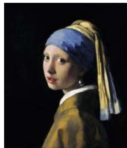
Johannes Vermeer van Delft, Dziewczyna z perłą (Dziewczyna z perłowych kolczykach), ok. 1665

indywidualizm, subiektywizm. Twórcy tej epoki lubowali się w stwarzaniu iluzji (malarstwo). W baroku można obserwować dążenie do syntezy sztuk. Najpełniej realizowała się ona w operze, gdzie bogata scenografia miała w sobie elementy architektury, malarstwa i rzeźby, a partie wokalne wykonywane przez śpiewaków łączyły muzykę, tekst literacki i teatralne środki wyrazu.